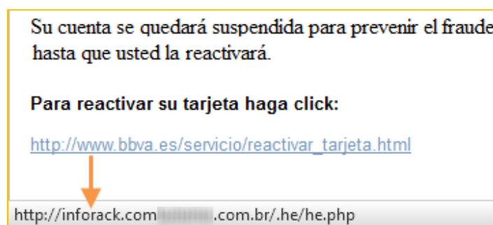
Imagen 1 – Phishing que apunta a un sitio falso