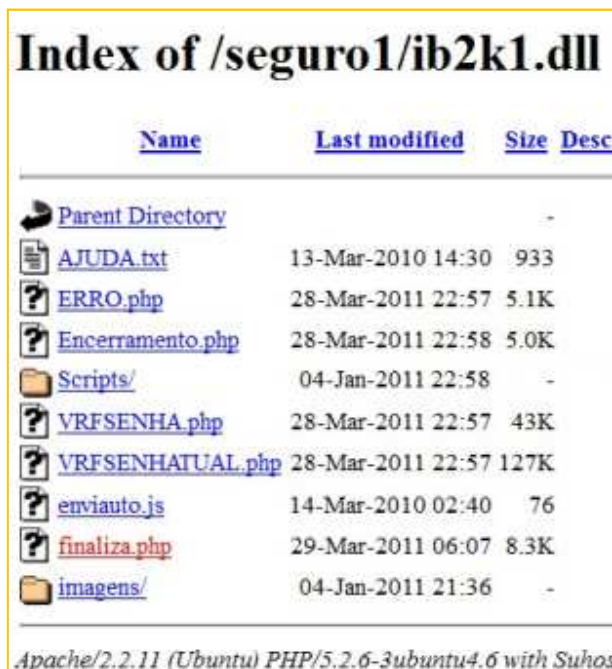
Imagen 8 – Archivos dañinos almacenados en un servidor vulnerable

Cualquier tipo de información que se encuentre es útil para continuar con la denuncia del caso o comenzar con uno nuevo.