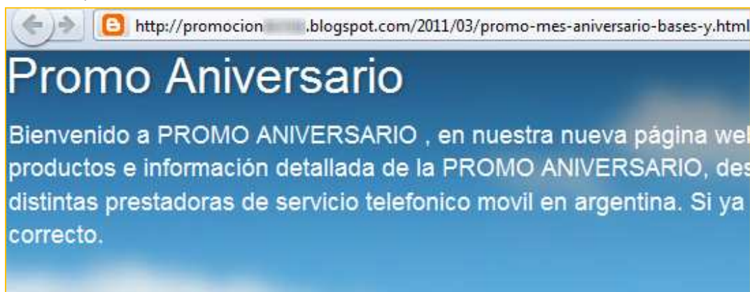
Imagen 7 – Sitio con promociones falsas alojado en Blogger

Por ejemplo la siguiente página alojada en Blogger y que ofrece supuestos premios de compañías telefónicas: