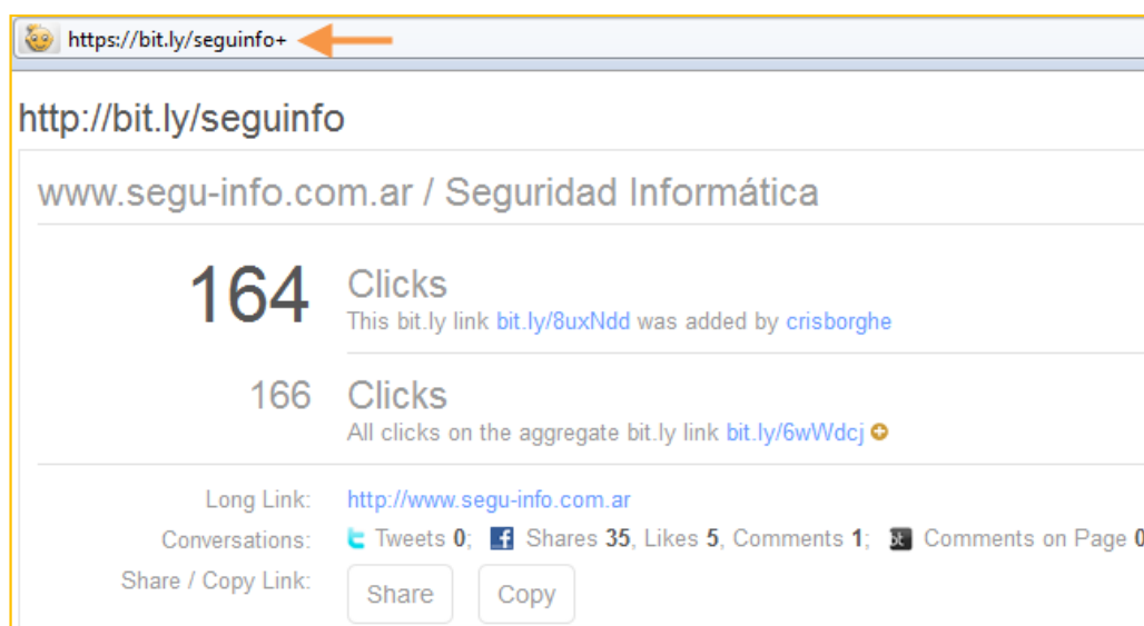
Imagen 10 – Datos de una URL acortada